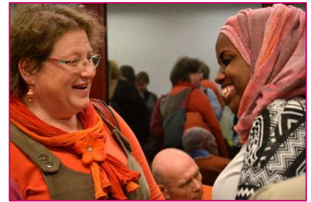
Ci-dessus, à Louvain-la-Neuve. L'antenne y organisait son premier dîner intergénérationnel.